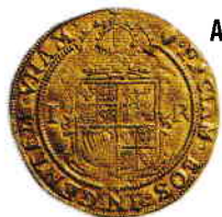
A. Monedă (anul 1700)

Lucrați în perechi. Imaginați-vă că sunteți istorici care cercetează cele trei obiecte redată în imaginile A , B , C . Observați obiectele, apoi scrieți pe caiete răspunsurile care completează tabelul alăturat.