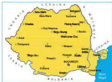
A. România, azi