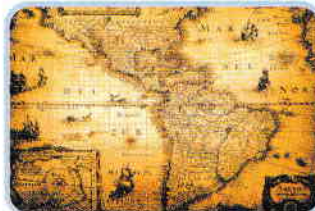
C. Hartă (1632)