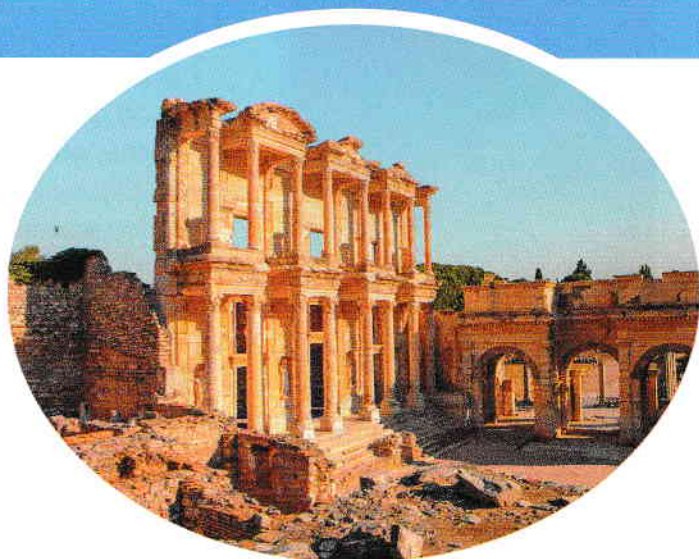
Biblioteca lui Celsus. Orașul antic Efes (azi, Turcia)