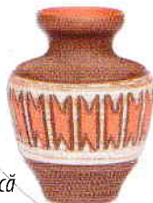
B. Vas antic din ceramică