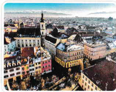
Orașul Sibiu (România), comunitate care datează din Epoca Medievală